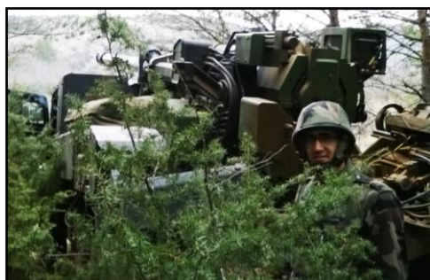
Manipulation CAESAR avec le 68RAA - Canjuers

Choissant l'Artillerie comme arme pour la suite, j'ai été formé artilleur sol-sol et sol-air au Groupement d'Application de l'Ecole d'Artillerie de Draguignan. Des simulateurs MISTRAL et VBS2 à la manipulation d'ATLAS sur le terrain en batterie de tir CAESAR, en passant par l'utilisation des matériels ROIM et RORAD les plus récents et des cours d'initiation FAC, j'ai pu acquérir les compétences qui me permettent aujourd'hui d'intégrer sciemment une unité d'artillerie.