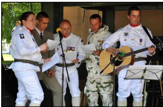
Chant par les lieutenants du 93 - 90ans du régiment

Le module Djibouti de la batterie Belledonne prépare activement son départ fin juin, et je suis invité à les rejoindre pour un camp de cohésion avant projection à Chambaran. Nouvelle batterie, nouvel environnement. Des instructions NBC, contre-IED, proterre, ISTC et secourisme sont ponctuées d'activités cohésion : course d'orientation et marche de nuit.